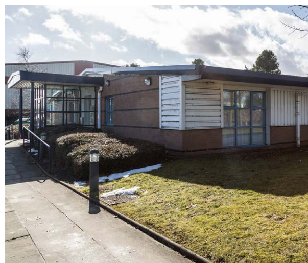
Les locaux d'Apex à Loanhead