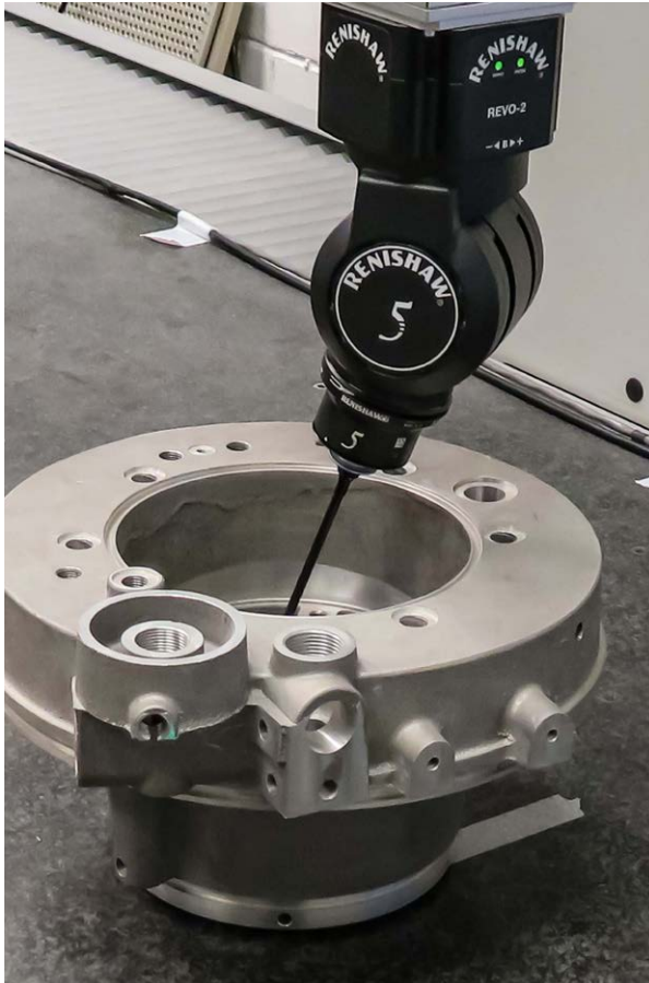
Tête 5 axes REVO proposant une capacité de positionnement infini

En partenariat étroit avec Renishaw depuis sa création, Apex offrait à ses clients les services d'une base installée d'équipements MMT en interne comprenant des systèmes MMT 3 axes utilisant des palpeurs de scanning et à déclenchement par contact conventionnels, montés sur des têtes indexables motorisées PH10.